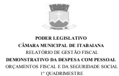
Tabela 1 - Demonstrativo da Despesa com Pessoal - Estados, DF, Municípios RGF - ANEXO I (LRF, art. 55, inciso I, alínea "a")